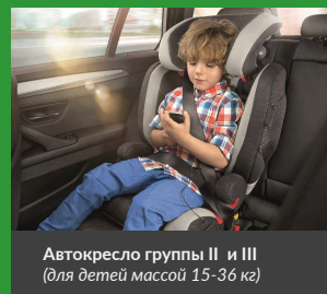
Автокресло группы II и III (для детей массой 15-36 кг)