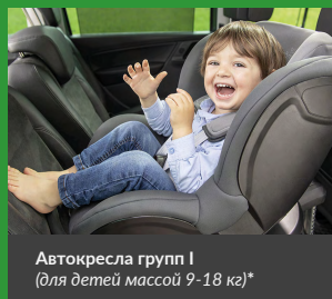
Автокресла групп I (для детей массой 9-18 кг)*